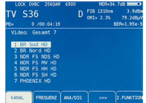
Messung eines optischen BK-Signals mit Auswertung der gewohnten HF-Parameter.